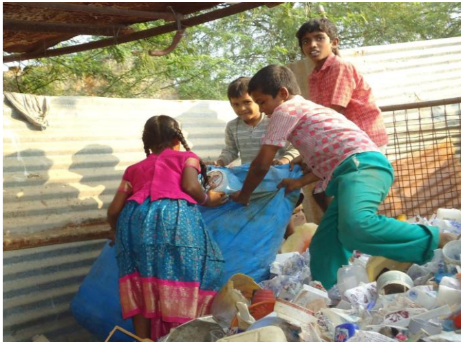
Bilderklärung: Kinder beim Müllsammeln in Indien.